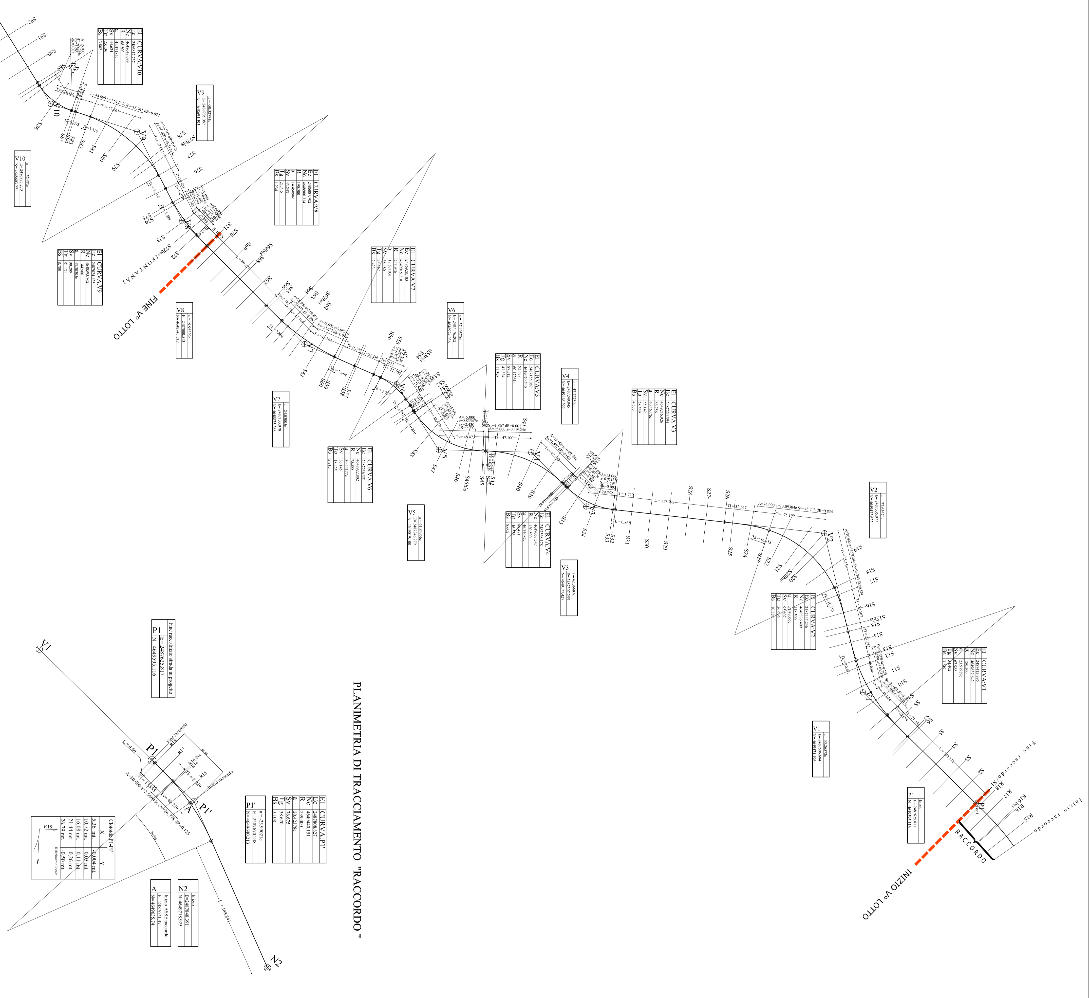
PLANIMETRIA DI TRACCIAMENTO "RACCORDO"